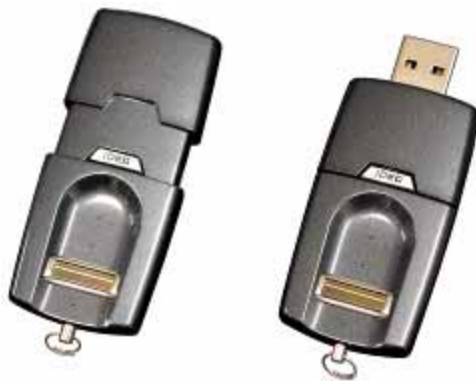
「BioSlimDisk iDEA Pro」

高速・高精度の指紋認証技術で市場をリードするエムコマース株式会社（神奈川県横浜市港北区：代表取締役社長 吉野 則幸 以下、エムコマース）と、株式会社三技協（神奈川県横浜市都筑区：代表取締役社長 仙石 通泰 以下、三技協）は、エムコマースの指紋認証付き USB フラッシュメモリ「BioSlimDisk iDEA Pro」と、三技協のシンククライアント・リモートアクセスシステム「PlatformV System」を連携し、より強固なセキュリティを実現したリモートアクセス製品の提供を開始します。